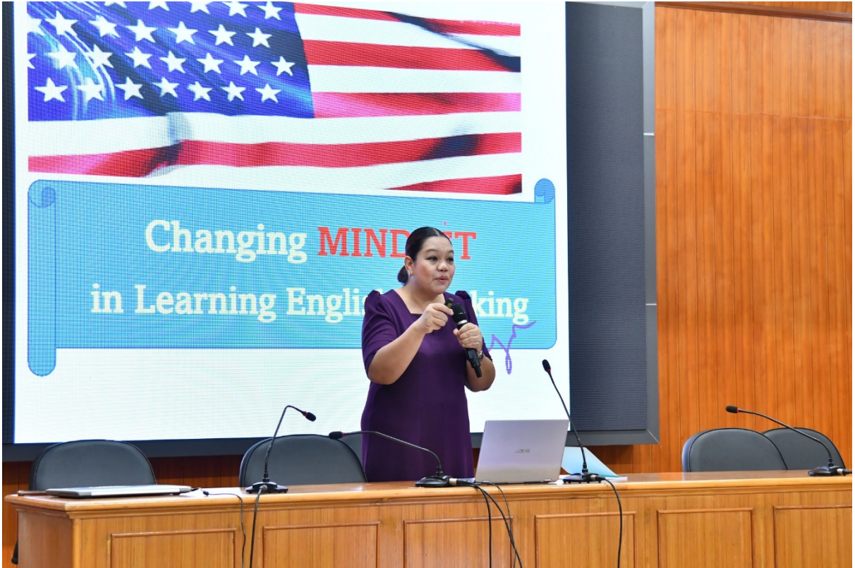
กิจกรรมที่ 2: การเรียนรู้เป็นกลุ่มจากฐานการเรียนรู้ 5 ฐาน และมีวิทยากรประจำกลุ่ม