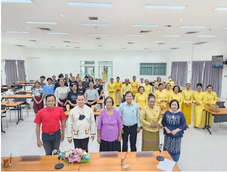
ภาพที่ 5 กิจกรรมวันที่ 9 มีนาคม 2567 ถ่ายภาพร่วมกัน