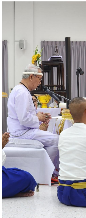
ภาพที่ 19 กิจกรรมวันที่ 10 มีนาคม 2567 ผู้ทำพิธีไหว้ครูนาฏศิลป์อ่านโองการ