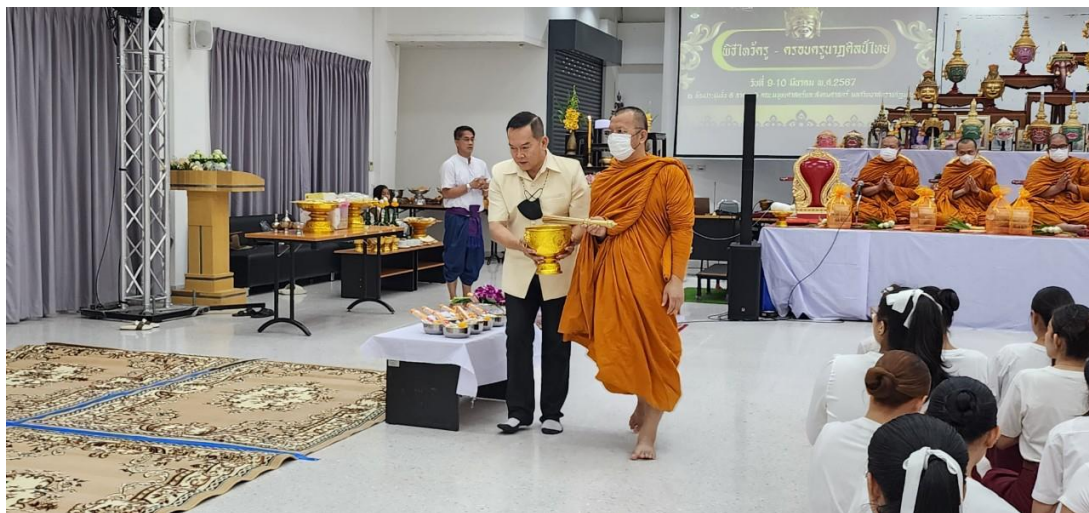
ภาพที่ 15 กิจกรรมวันที่ 10 มีนาคม 2567 พระสงฆ์ปะพรมน้ำพระพุทธมนต์