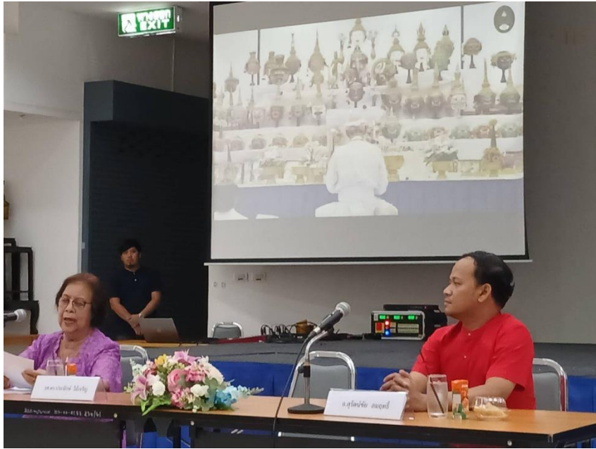
ภาพที่ 3 กิจกรรมวันที่ 9 มีนาคม 2567 อภิปรายความสำคัญของพิธีไหว้ครูนาฏศิลป์ และการรำ เพลงหน้าพาทย์ประกอบพิธีไหว้ครูนาฏศิลป์