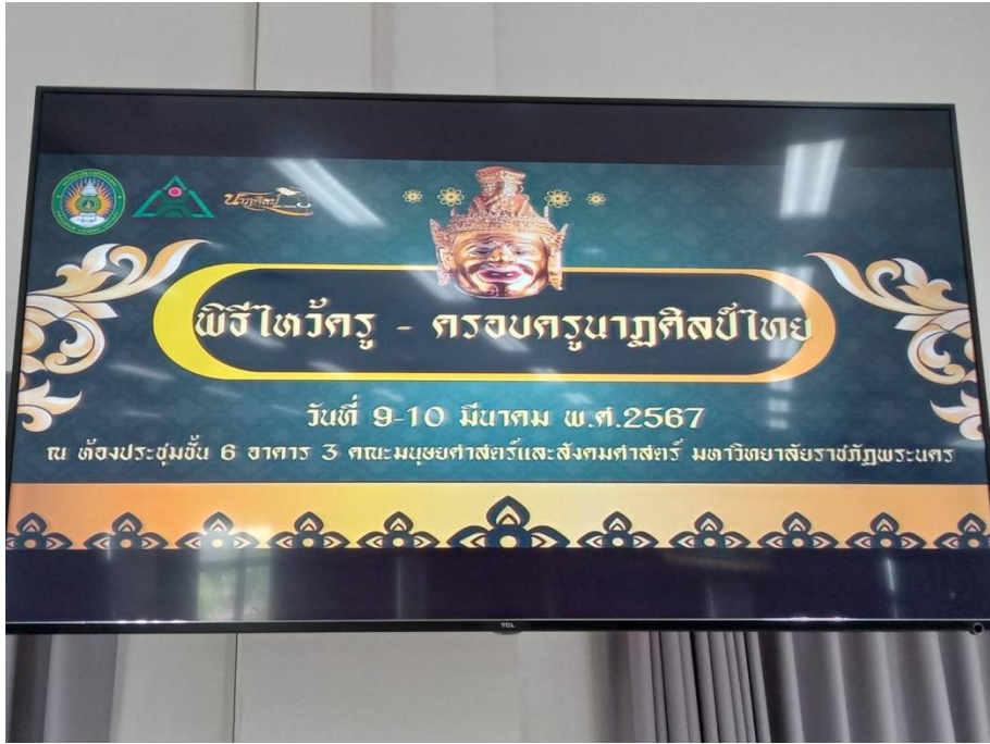
ภาพที่ 1 กิจกรรมวันที่ 9 มีนาคม 2567 อภิปรายความสำคัญของพิธีไหว้ครูนาฏศิลป์ และการรำ เพลงหน้าพาทย์ประกอบพิธีไหว้ครูนาฏศิลป์