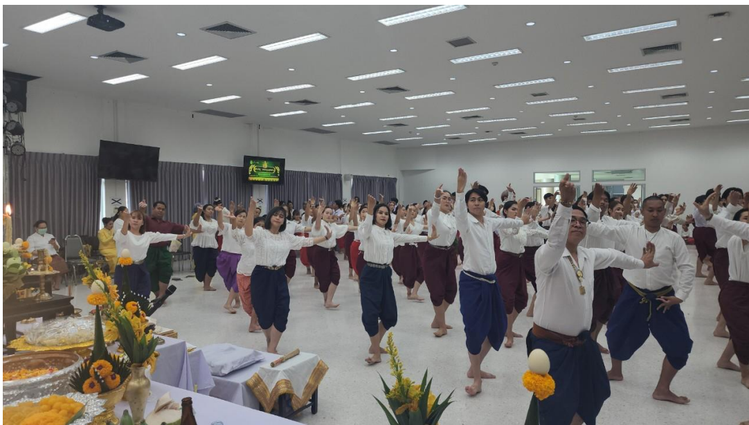
ภาพที่ 23 กิจกรรมวันที่ 10 มีนาคม 2567 รำถวายมือ