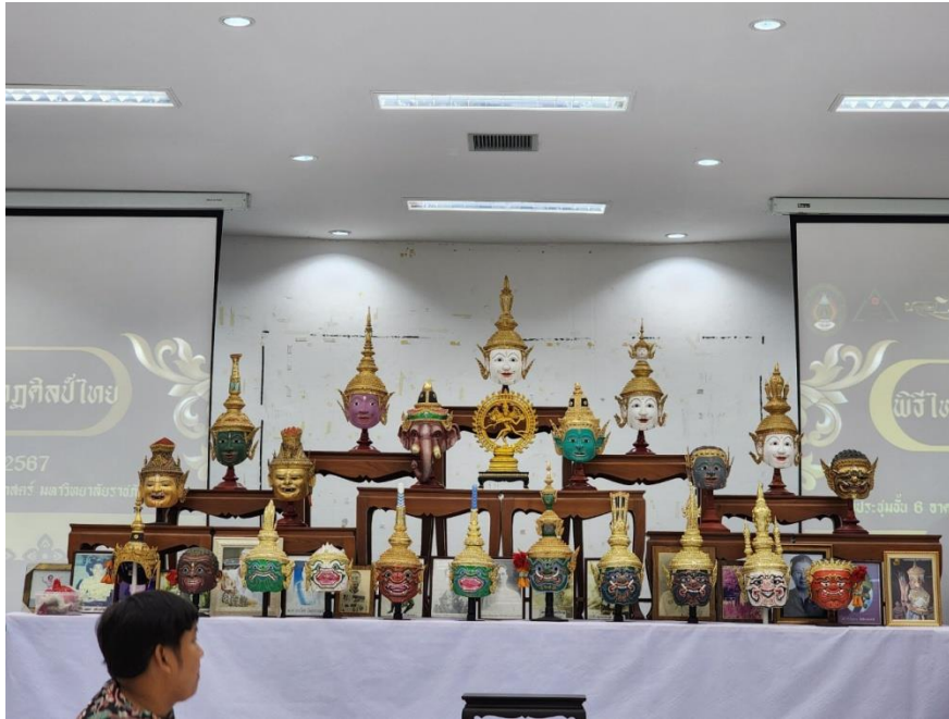
ภาพที่ 12 กิจกรรมวันที่ 10 มีนาคม 2567 จัดประรมพิธีพิธีไหว้ครูนาฏศิลป์เรียบร้อย