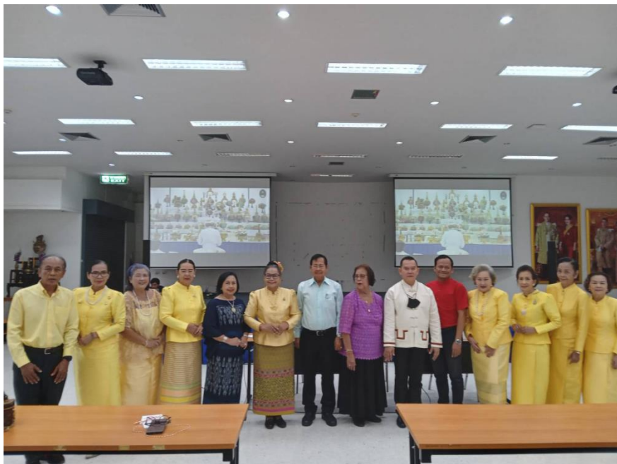
ภาพที่ 2 กิจกรรมวันที่ 9 มีนาคม 2567 ประธาน วิทยากร และผู้เข้าร่วมงาน