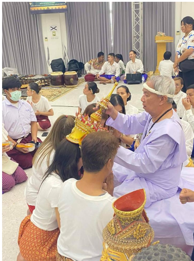
ภาพที่ 25 กิจกรรมวันที่ 10 มีนาคม 2567 ผู้ประกอบพิธีครอบ