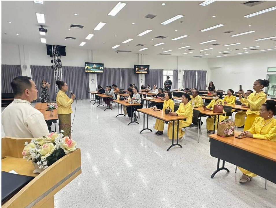
ภาพที่ 9 กิจกรรมวันที่ 9 มีนาคม 2567 ประธานกล่าวแสดงความยินดี ทีมฯ