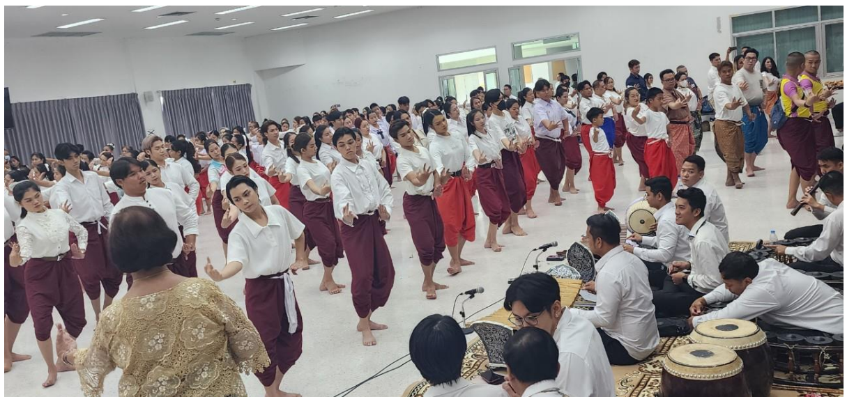
ภาพที่ 21 กิจกรรมวันที่ 10 มีนาคม 2567 รำถวายมือ