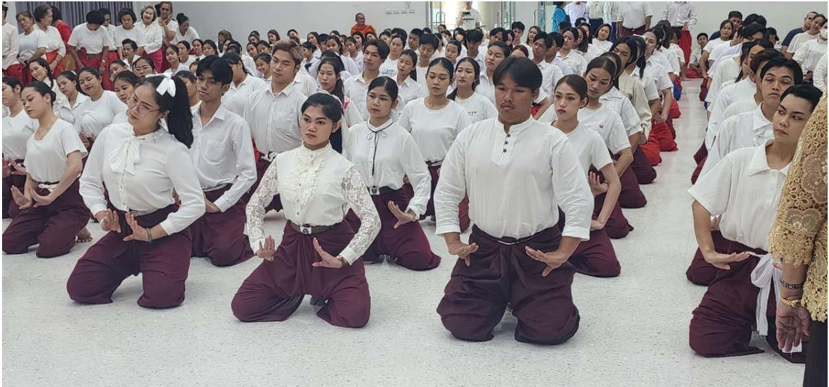
ภาพที่ 20 กิจกรรมวันที่ 10 มีนาคม 2567 รำถวายมือ