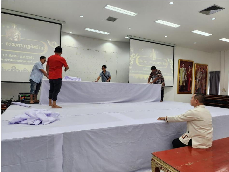
ภาพที่ 10 กิจกรรมวันที่ 10 มีนาคม 2567 จัดประรมพิธีไหว้ครูนาฏศิลป์