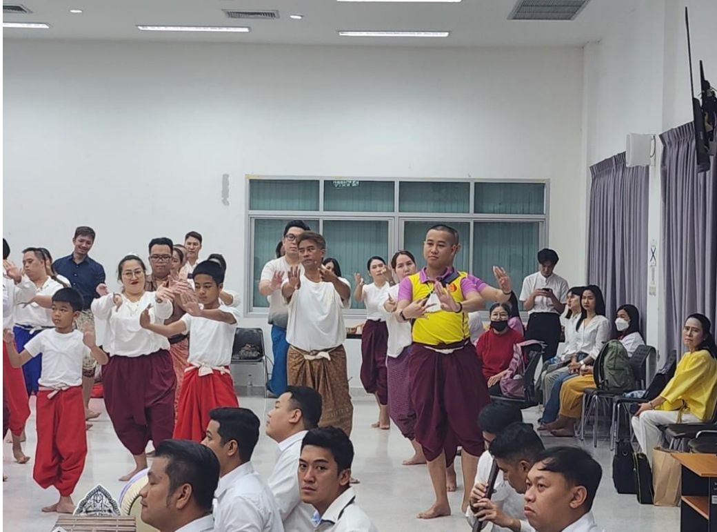
ภาพที่ 22 กิจกรรมวันที่ 10 มีนาคม 2567 รำถวายมือ