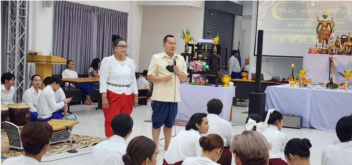
ภาพที่ 16 กิจกรรมวันที่ 10 มีนาคม 2567 แนะนำความรู้เรื่องพิธีไหว้ครูกับผู้ร่วมงาน