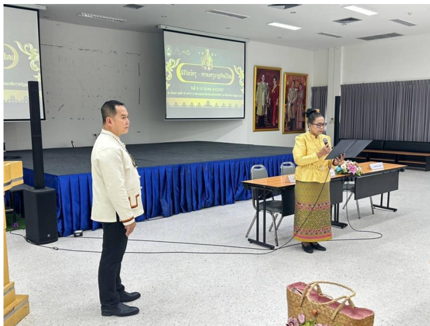
ภาพที่ 8 กิจกรรมวันที่ 9 มีนาคม 2567 ประธานกล่าวเปิดงาน