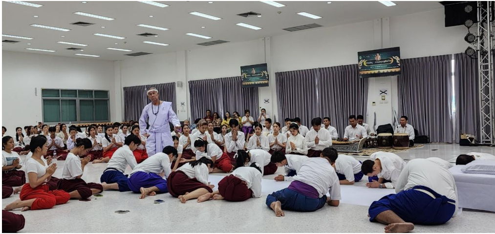
ภาพที่ 18 กิจกรรมวันที่ 10 มีนาคม 2567 ผู้ทำพิธีไหว้ครูนาฏศิลป์เริ่มพิธี