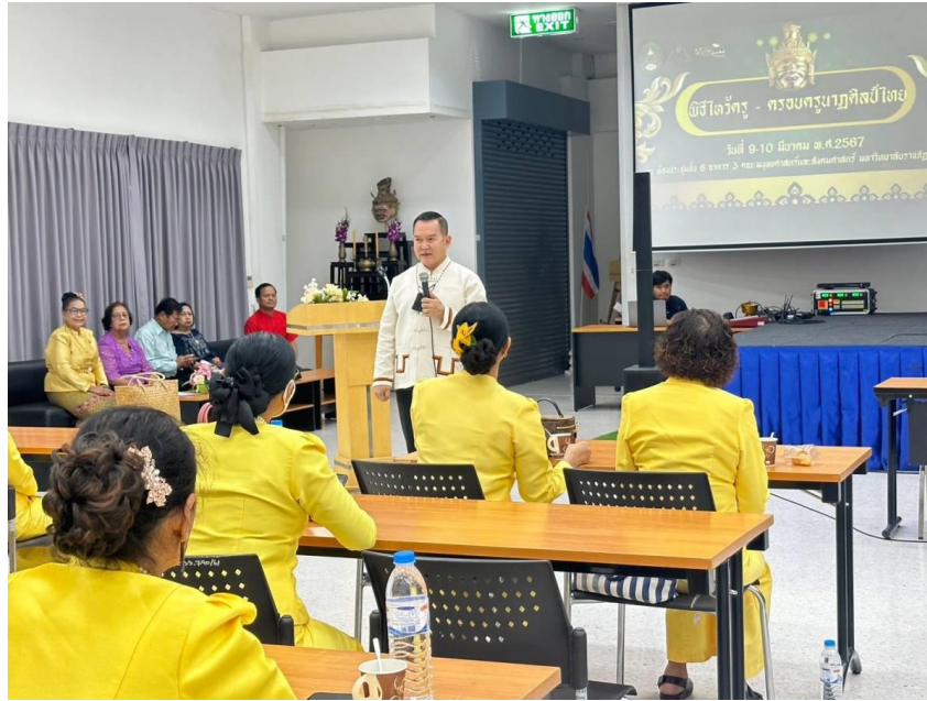
ภาพที่ 7 กิจกรรมวันที่ 9 มีนาคม 2567 ผู้จัดโครงการอธิบายถึงที่มาของการจัดโครงการ