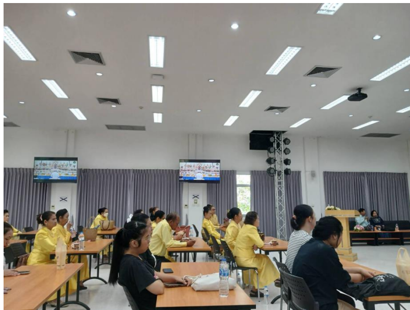
ภาพที่ 4 กิจกรรมวันที่ 9 มีนาคม 2567 ผู้เข้าร่วมฟังอภิปรายความสำคัญของพิธีไหว้ครูนาฏศิลป์ และการรำเพลงหน้าพาทย์ประกอบพิธีไหว้ครูนาฏศิลป์