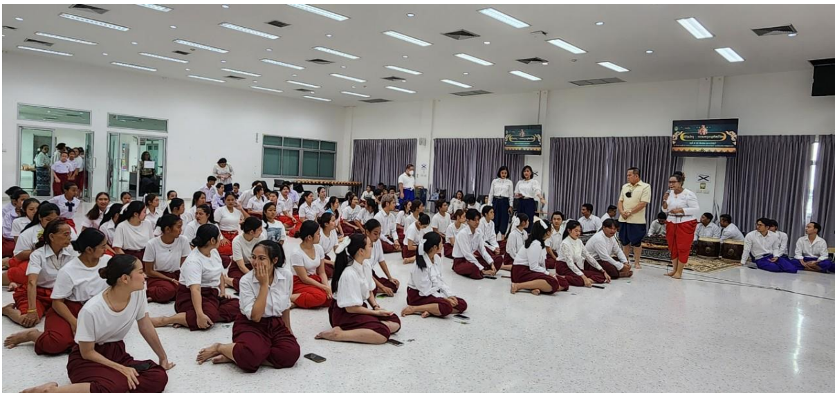
ภาพที่ 17 กิจกรรมวันที่ 10 มีนาคม 2567 ประธานในพิธีกล่าวต้อนรับ