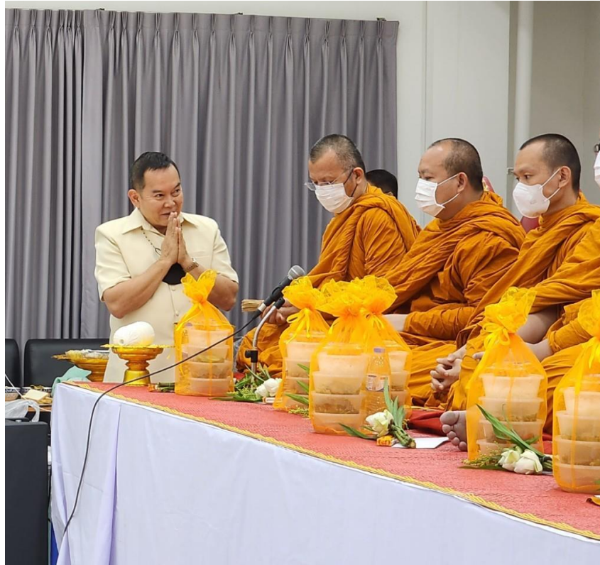
ภาพที่ 14 กิจกรรมวันที่ 10 มีนาคม 2567 พิธีเลี้ยงพระเช้า