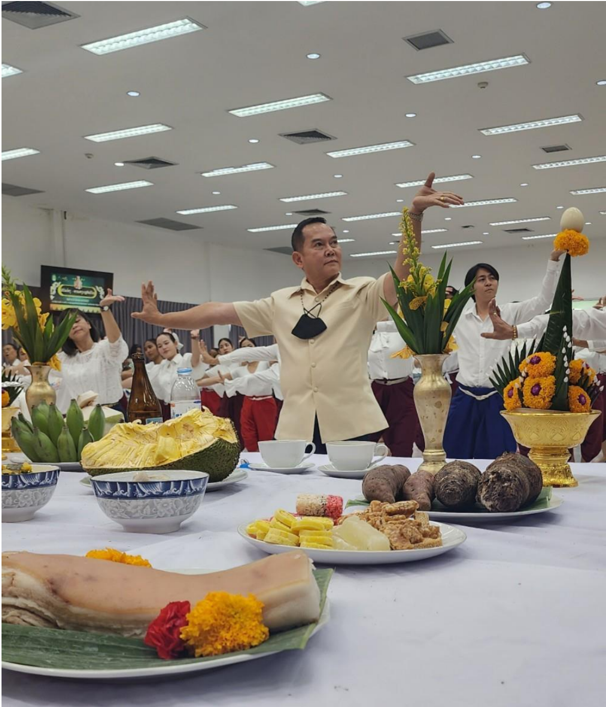
ภาพที่ 24 กิจกรรมวันที่ 10 มีนาคม 2567 รำถวายมือ