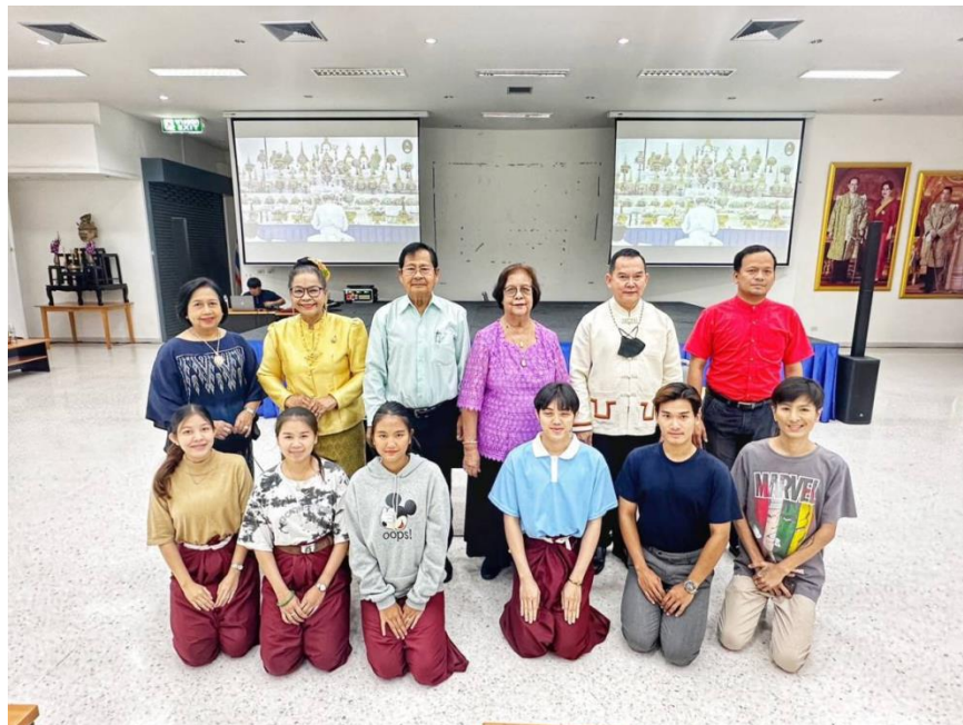
ภาพที่ 6 กิจกรรมวันที่ 9 มีนาคม 2567 นักศึกษากับวิทยากร ที่มา ถ่ายภาพโดยผู้ดำเนินงาน